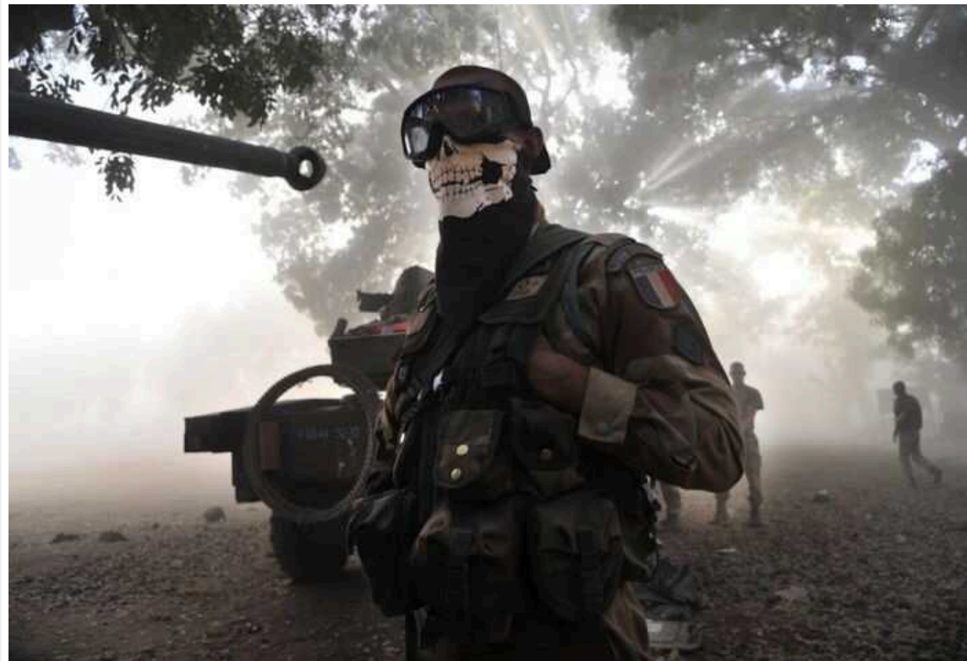
Times: Колишні солдати французького Іноземного легіону воюють в Україні по обидва боки фронту

По обидва боки лінії фронту в Україні воюють колишні солдати французького Іноземного легіону – елітного підрозділу армії Франції, що комплектується переважно з іноземців.