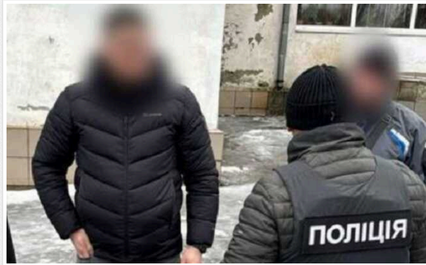
У Кривому Розі затримали керівника громадської організації: допомагав "ухилянтам"

Правоохоронці у Кривому Розі затримали керівника громадської організації, який за 10 тисяч доларів допомагав ухилятися від мобілізації.