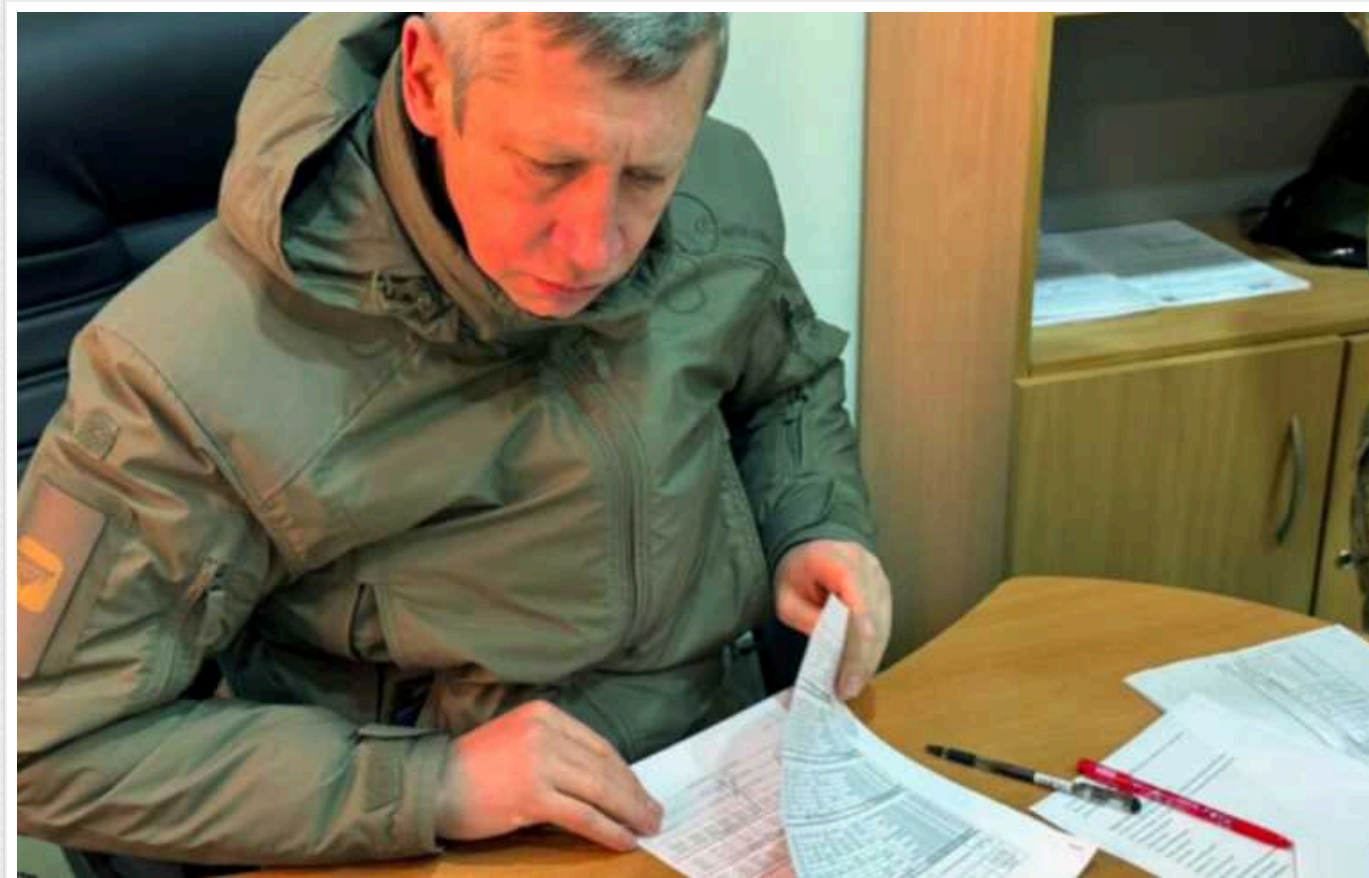
Міністерство оборони проводить перевірку продовольчих складів Збройних Сил України

Представники Міноборони влаштували раптову перевірку продуктових складів для ЗСУ. Приводом стали скарги військових.