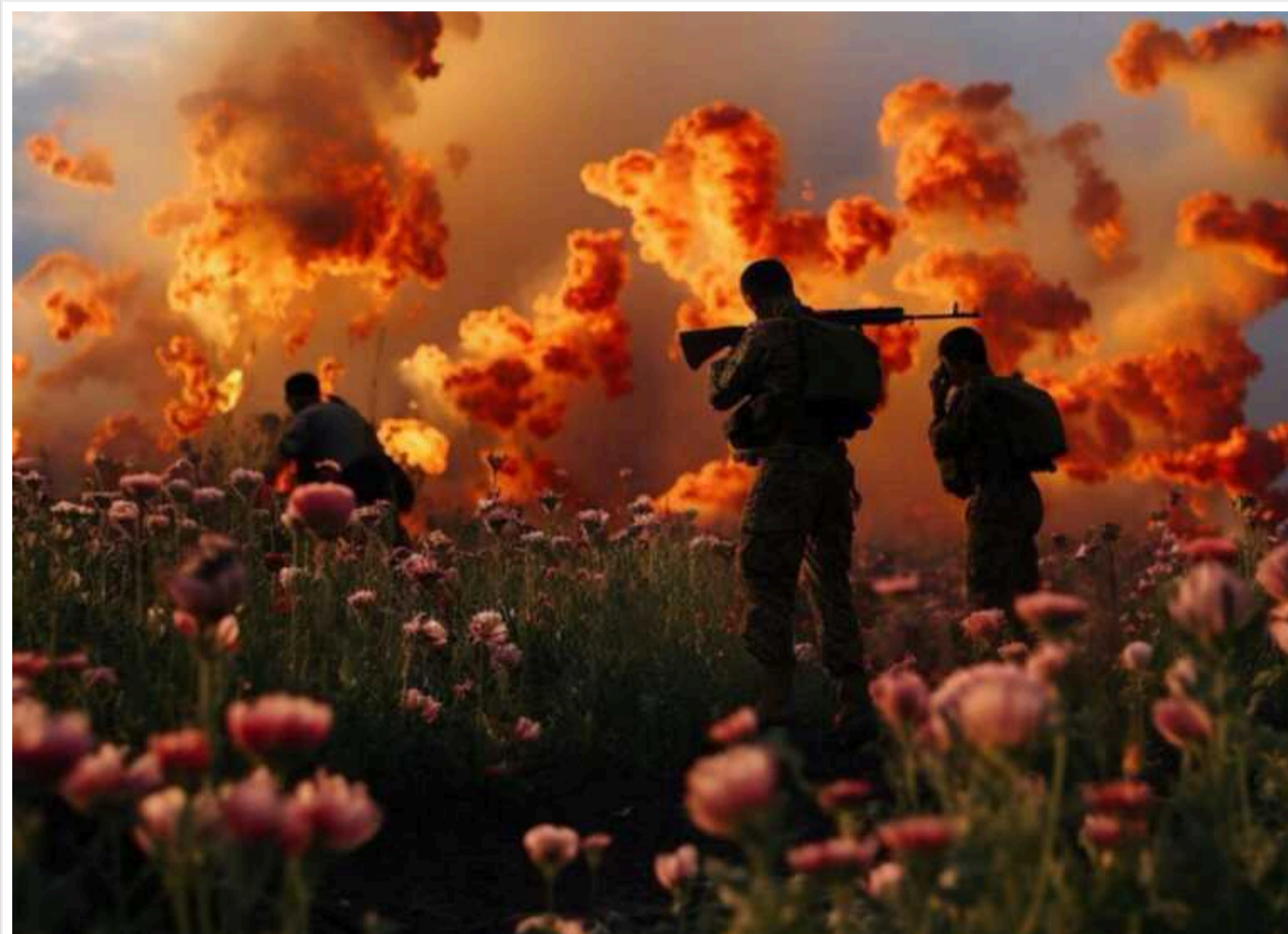
В Афганістані минулого року під керівництвом талібів було вироблено на 95% менше опіумного маку: зараз в лідерах М'янма, - DW

Кількість вирощування опіуму в Афганістані поменшала до 333 тонн після виведення американських військ. Показник було отримано в результаті аналізу аерофотознімків.