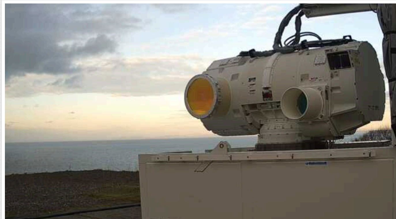
Британці випробували лазерну зброю DragonFire для повітряних цілей: влучає в монету

Уряд Великої Британії заявив про перше успішне випробування лазерної технології проти повітряних цілей, вона може "посилити Збройні сили країни з більшою точністю, зменшивши при цьому залежність від високовартісних боеприпасів".