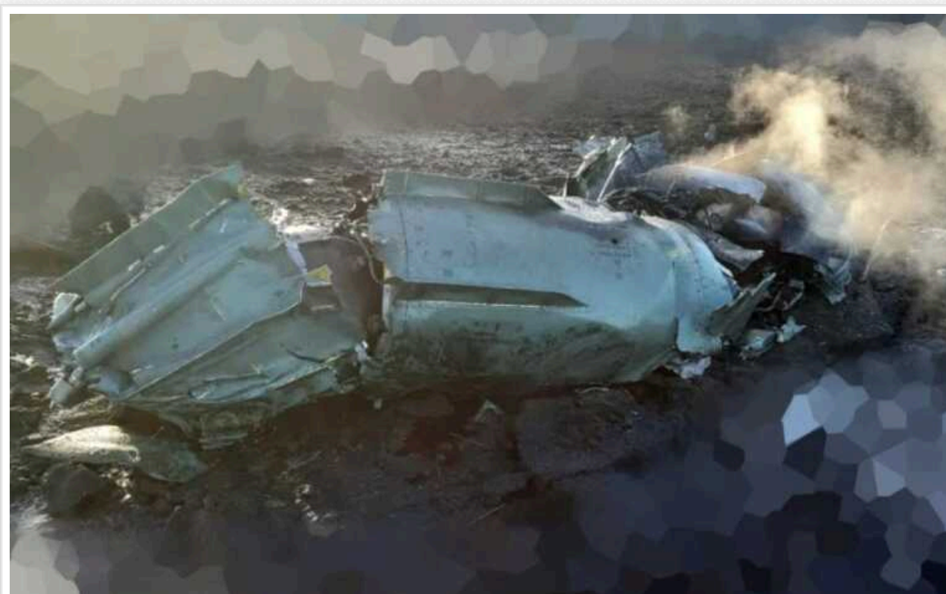
Росія завдала удару по Україні рідкісною 4-тонною протикорабельною ракетою П-35 60-х років

РФ для ударів по Україні використала ракету П-35 (ЗМ44 "Прогрес"), уламки якої було знайдено, це перший відомий випадок її застосування.