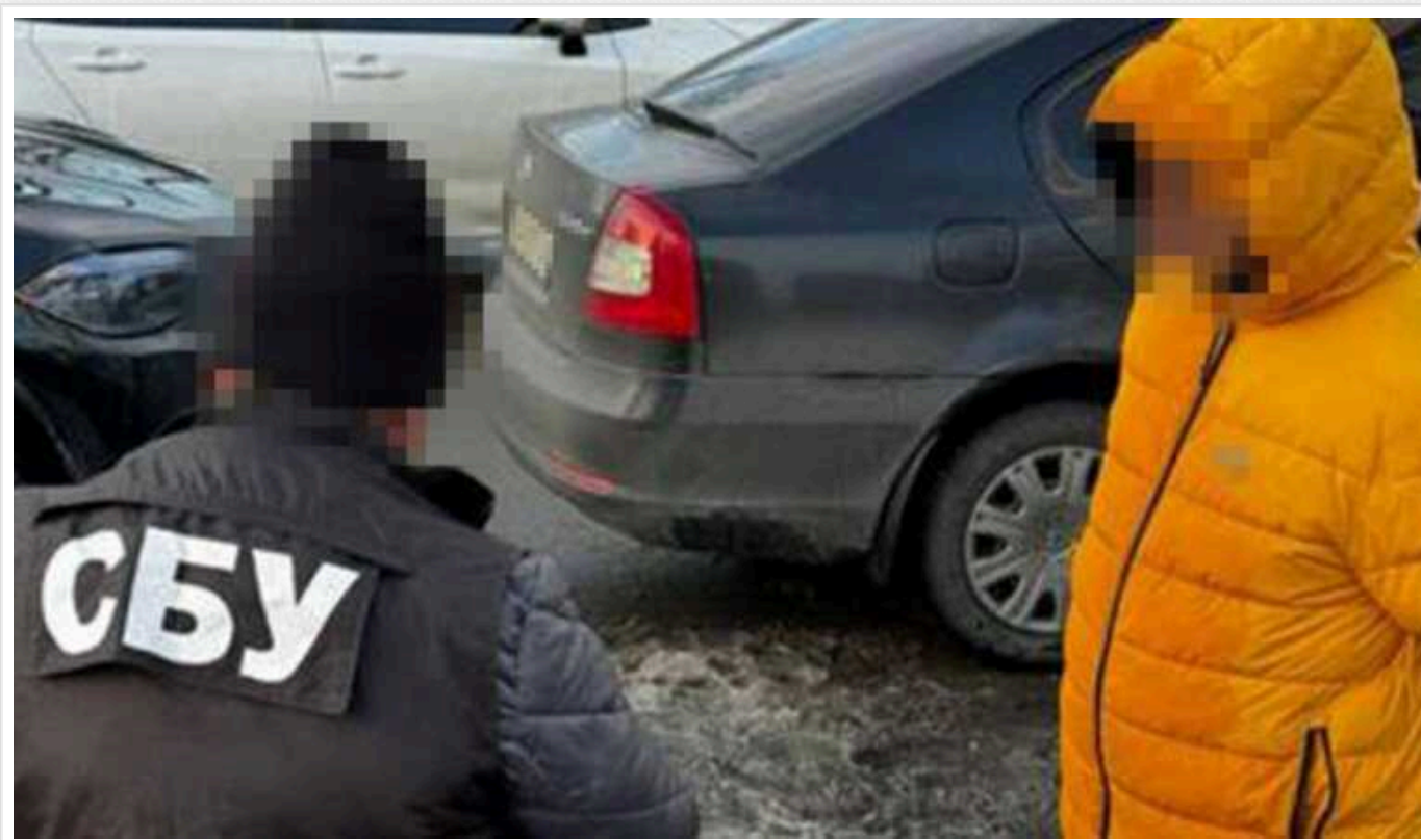
СБУ затримала зловмисників, які розкрадали бюджетні кошти, призначені для Сил оборони

У результаті комплексних заходів у Києві «на гарячому» затримано начальника одного з управлінь Командування Сил підтримки ЗСУ та його співника – гендиректора компанії-постачальника оборонних товарів.