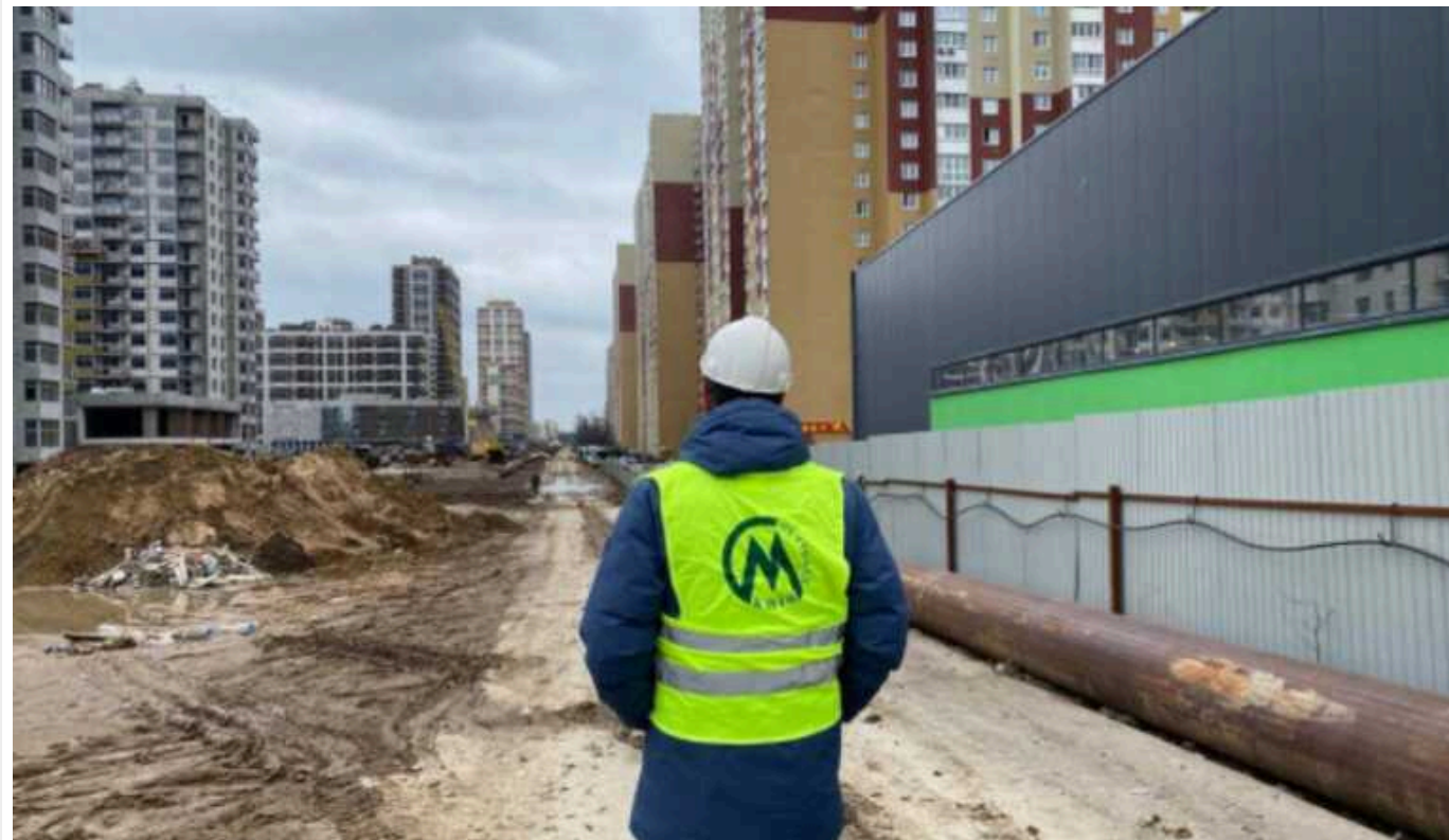
Метро на Виноградар: справу про стягнення з "Київметробуду" 139 мільйонів гривень поновлять

Київська прокуратура довела недоцільність експертизи у справі привласнення генеральним підрядником 139 мільйонів гривень під час будівництва метро на Виноградар. Як встановили правоохоронці, будівельна компанія АТ "Київметробуд" використала не за цільовим призначенням кошти, які були виділені з місцевого бюджету на будівництво нових станцій метро Сирецько-Печерської лінії. Справу, яку затягують вже понад два роки, поновлять у суді.