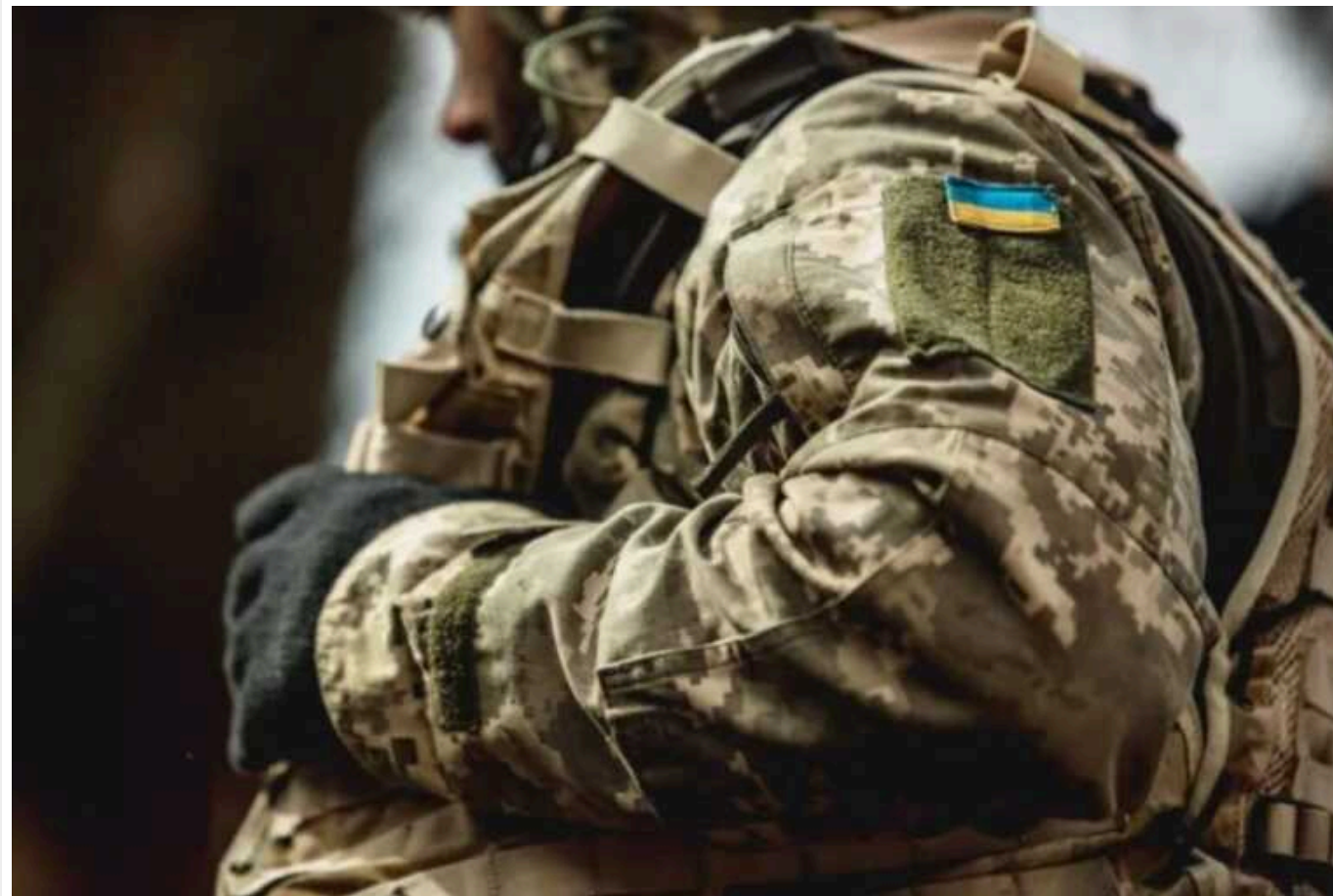
Внесено важливі зміни до бронювання військовозобов'язаних під час мобілізації в Україні

В Україні можуть змінитися правила бронювання військовозобов'язаних від мобілізації. Нововведення внесено до постанови Уряду №76 від 27 січня 2023 року.