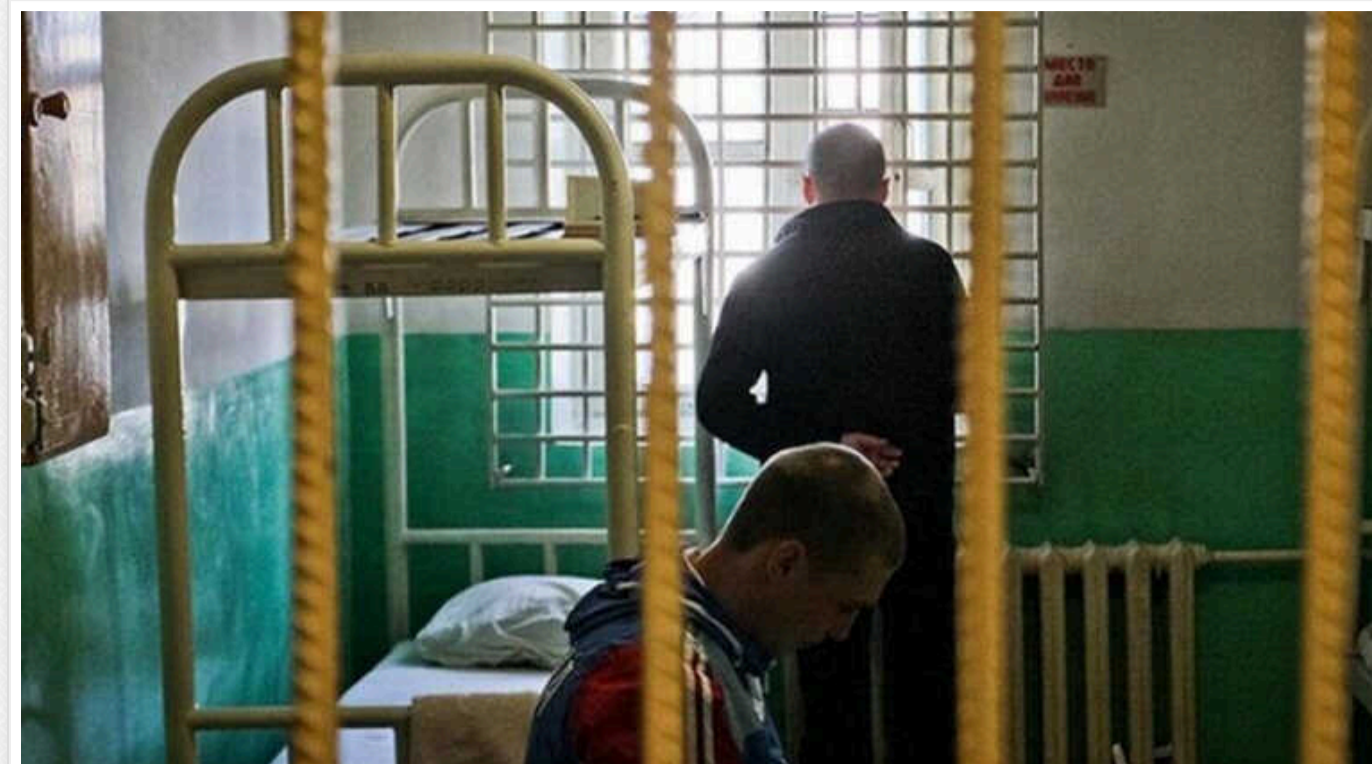
“Якщо раніше засуджені за злочини придуть до ТЦК, їм відмовлять у мобілізації”, - заступниця міністра юстиції Олена Висоцька

Росія роками працює над залученням засуджених до воєнних дій, маючи цілу систему навчання та вербування, й Україні варто поспішити у цьому напрямку, заявила в ефірі Українського Радіо заступниця міністра юстиції Олена Висоцька.