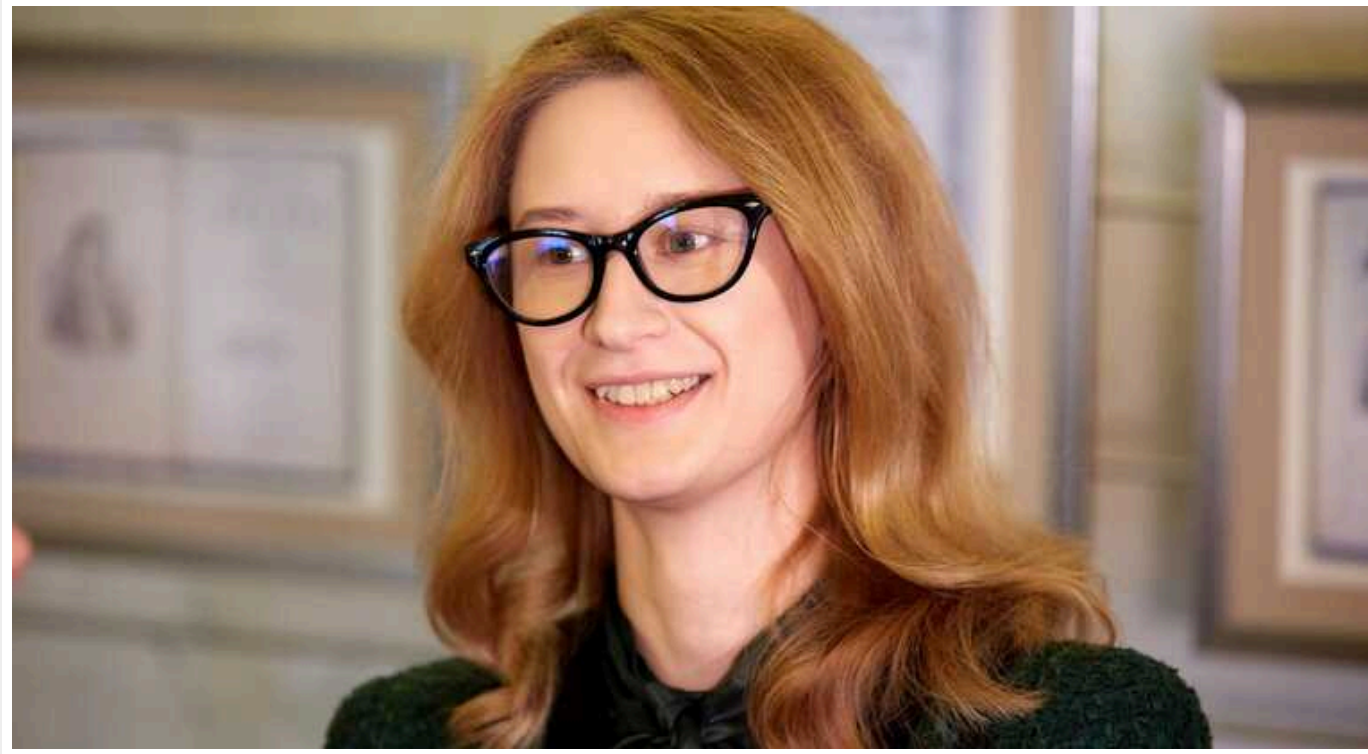
Що носить нардепка Підласа, яка запропонувала підвищити податки

Голова Комітету Верховної Ради з бюджету, народна депутатка Роксолана Підласа, запропонувала збільшити податки для українців, які заробляють від 20 тис. грн на місяць і підвищити військовий збір до 3%. Вона також запропонувала ввести окремі податки на розкіш, зокрема, сплачувати додаткове мито на нові айфони. Проте її власна любов до розкоші була помічена користувачами.