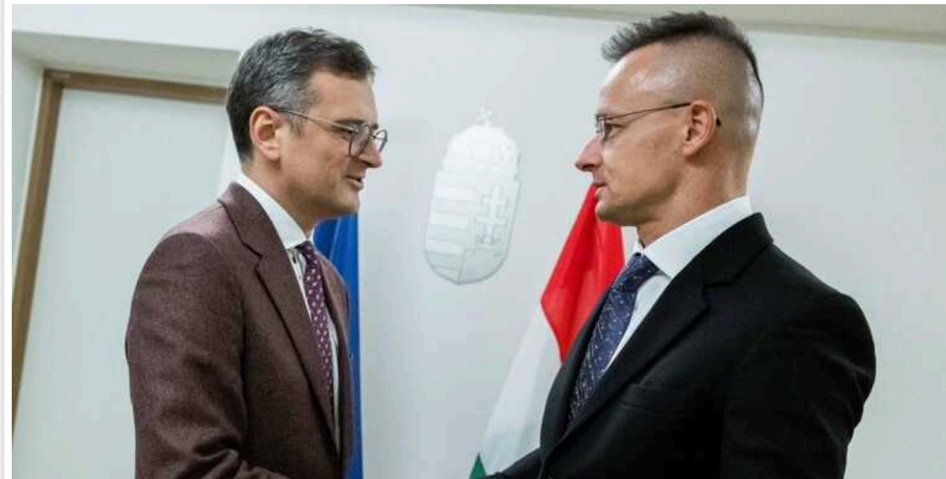
Голови МЗС України та Угорщини провели переговори: обговорили візит Сіярто до України

Голова Офісу президента Андрій Єрмак провів телефонну розмову з міністром закордонних справ і зовнішньої торгівлі Угорщини Петером Сіярто. Обговорили майбутній візит останнього до Ужгорода.