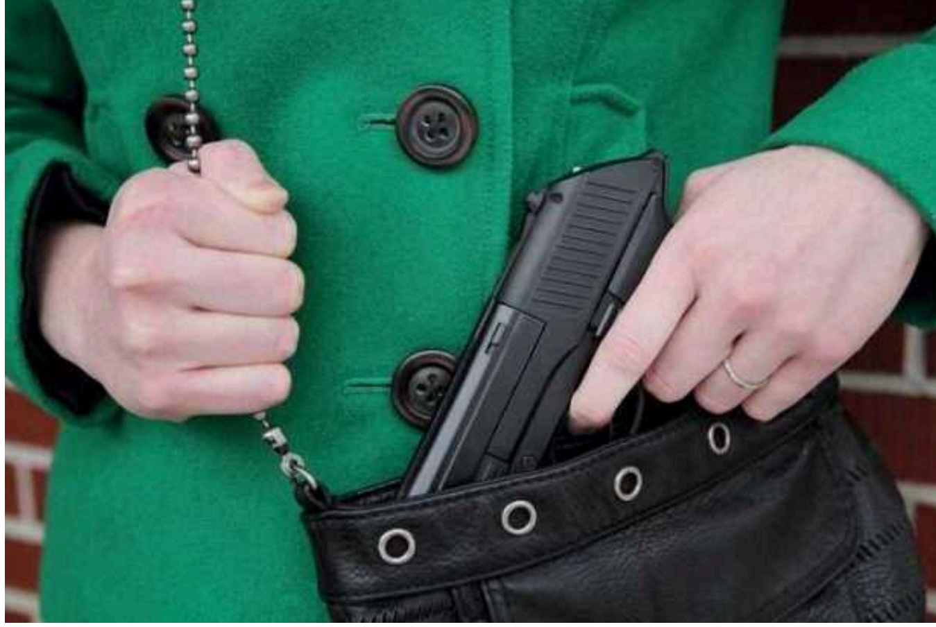
Які підводні камені приховує законопроект про легалізацію зброї для цивільних?

Україна залишається однією з небагатьох країн світу, де досі не врегульоване питання воєнної зброї для цивільних. У парламенті його обговорюють ще з 1990-х років. Депутати недовзі можуть легалізувати воєнну зброю. Утім, скористатися правом на самозахист зможуть далеко не всі.