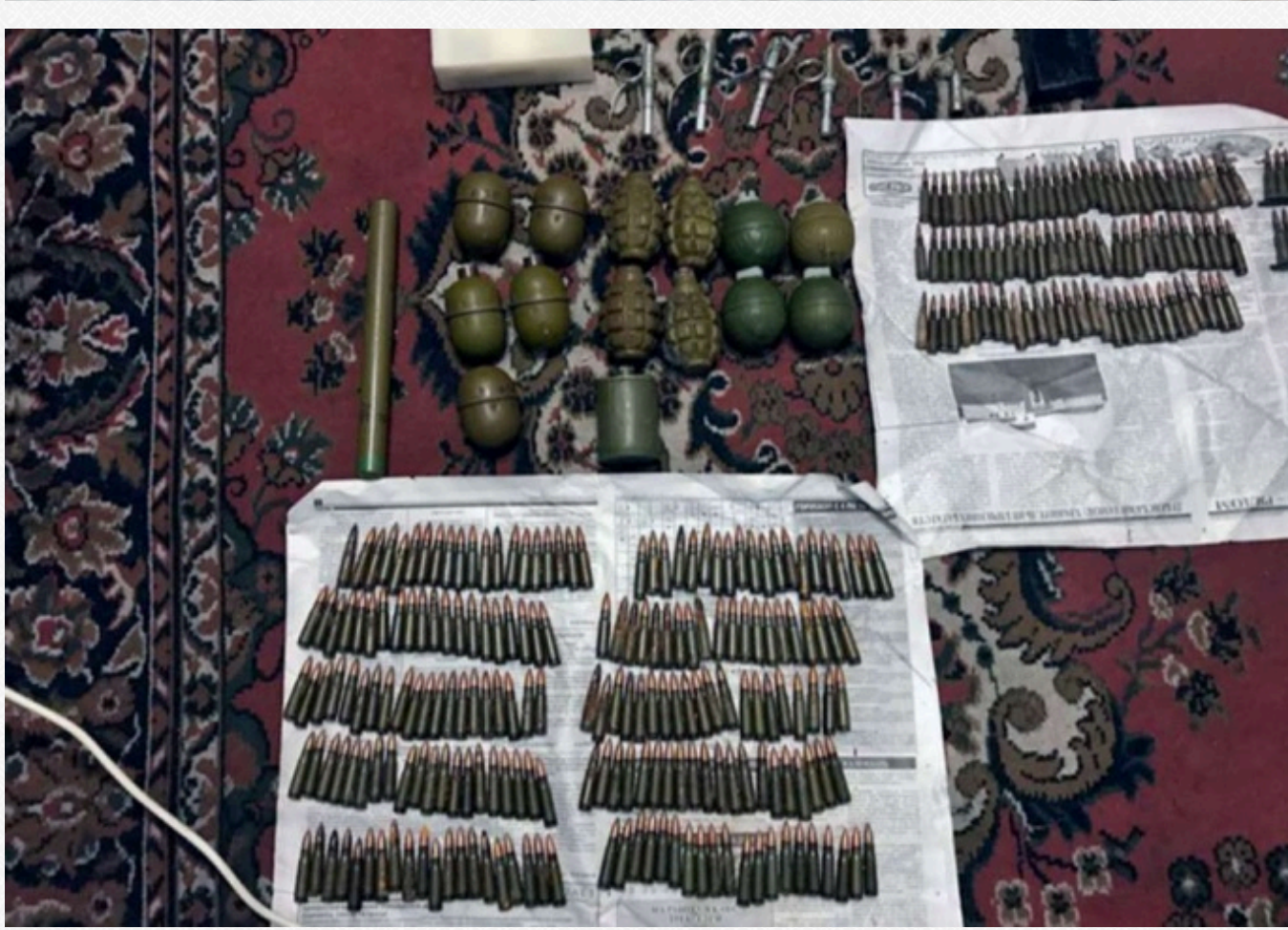
Патрони до воєнної зброї та інші боєприпаси, вилучені в членів злочинної організації, обвинувачених у катуванні та вбивстві, 2018 рік.

Іншими словами, злочинці і так мають доступ до зброї. Натомість законотворчі органи громадяни обмежені в праві на самозахист, адже мисливський карабін мало чим допоможе в разі нападу озброєних осіб посеред вулиці. Крім того, злочини, вчинені із застосуванням зареєстрованої зброї, буде значно легше розслідувати.