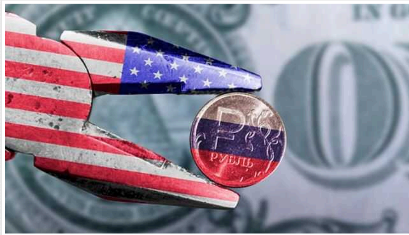
США вдарили по тіньовому флоту РФ: хто полатився за порушення нафтових санкцій

США запровадили додаткові санкції проти перевізників російської нафти. Американське Управління з контролю за іноземними активами (OFAC) внесло до санкційного списку судноплавну компанію Hennessea Shipping Company, що базується в ОАЕ і яку визначили кінцевим власником 18 танкерів.