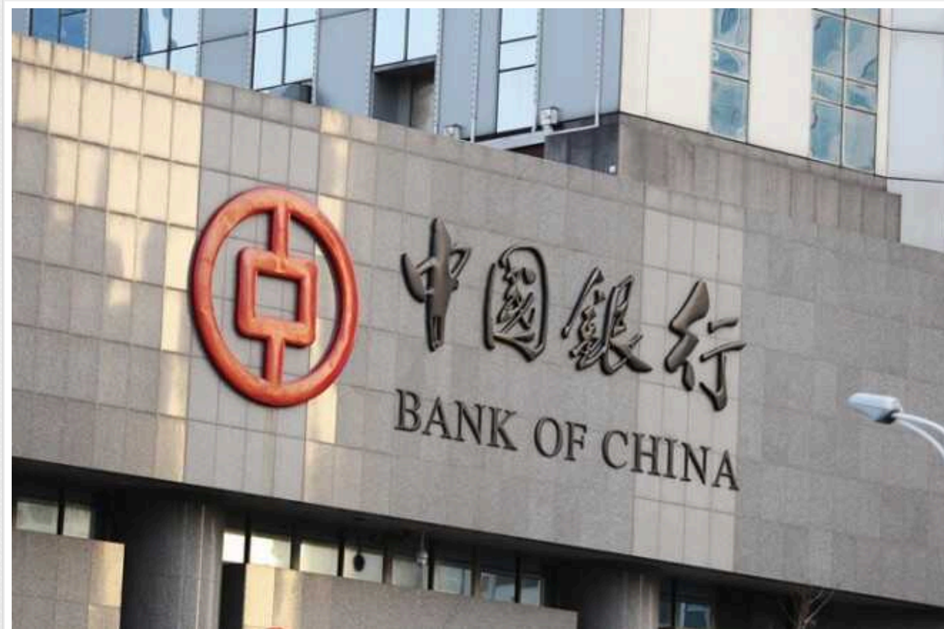
Мінфін США чинив тиск на китайські банки, щоб ті дотримувались санкцій проти РФ

Офіційні особи Міністерства фінансів США чинили тиск на китайські та іноземні банки в Гонконзі. Від них вимагали, щоб вони дотримувалися нових санкцій адміністрації американського президента Джо Байдена щодо російської військової промисловості.