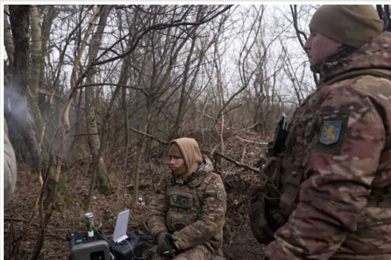
Дроневоди 47-ї ОМБр розповіли, як нищать ворога під Авдіївкою і як окупанти живуть поряд з тілами своїх загиблих

Оператори дронів 47-ї окремої механізованої бригади ЗСУ сьогодні нищать російських окупантів і техніку біля Степового на Авдіївському напрямку. Ситуація там тримається завдяки піхоті, а також FPV-дронам.