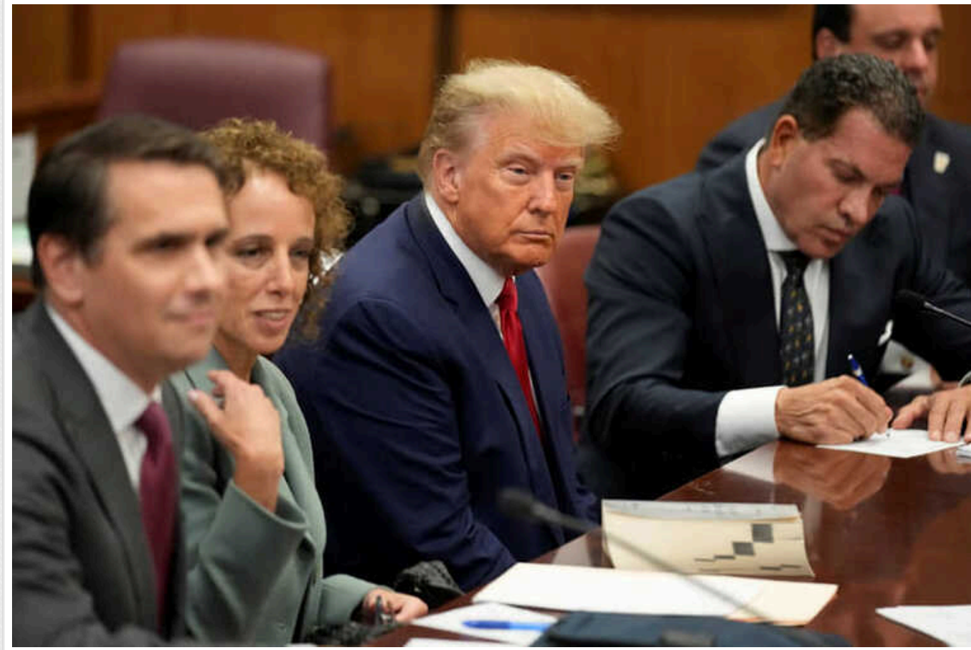
Обвинувачення у справі Трампа можуть скасувати через романтичні стосунки між прокурорами

У справі про звинувачення експрезидента США Дональда Трампа у спробі скасувати результати виборів 2020 року, під час якої відбувся штурм Капітолію, з'явився новий поворот. Прокурорів, які підтримують звинувачення, запідозрили у романтичних стосунках і вимагають скасувати обвинувальний акт.