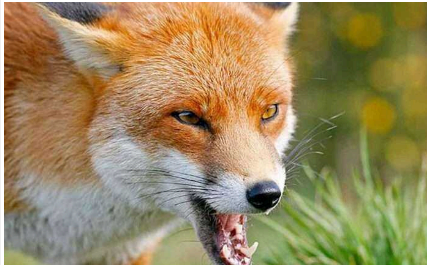
У Харківській області через війну зросла кількість випадків сказу диких тварин

Влада вирішила посилити протиепізоотичні заходи у Харківській області, оскільки через війну було неможливо вакцинувати тварин від сказу у 2022 році.