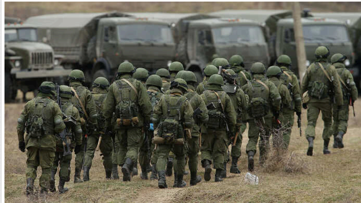
Окупанти за останні два дні активізувалися під Авдіївкою та просунулися вперед