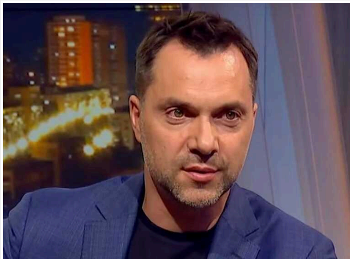
Експрадник ОП Арестович озвучив країни, де, на його думку, можна буде більш-менш безпечно «перечекати» епоху великих потрясінь

Глядачі поставили йому питання, куди безпечніше емігрувати, щоб не потрапити на чергову війну протягом найближчих 10-15 років.