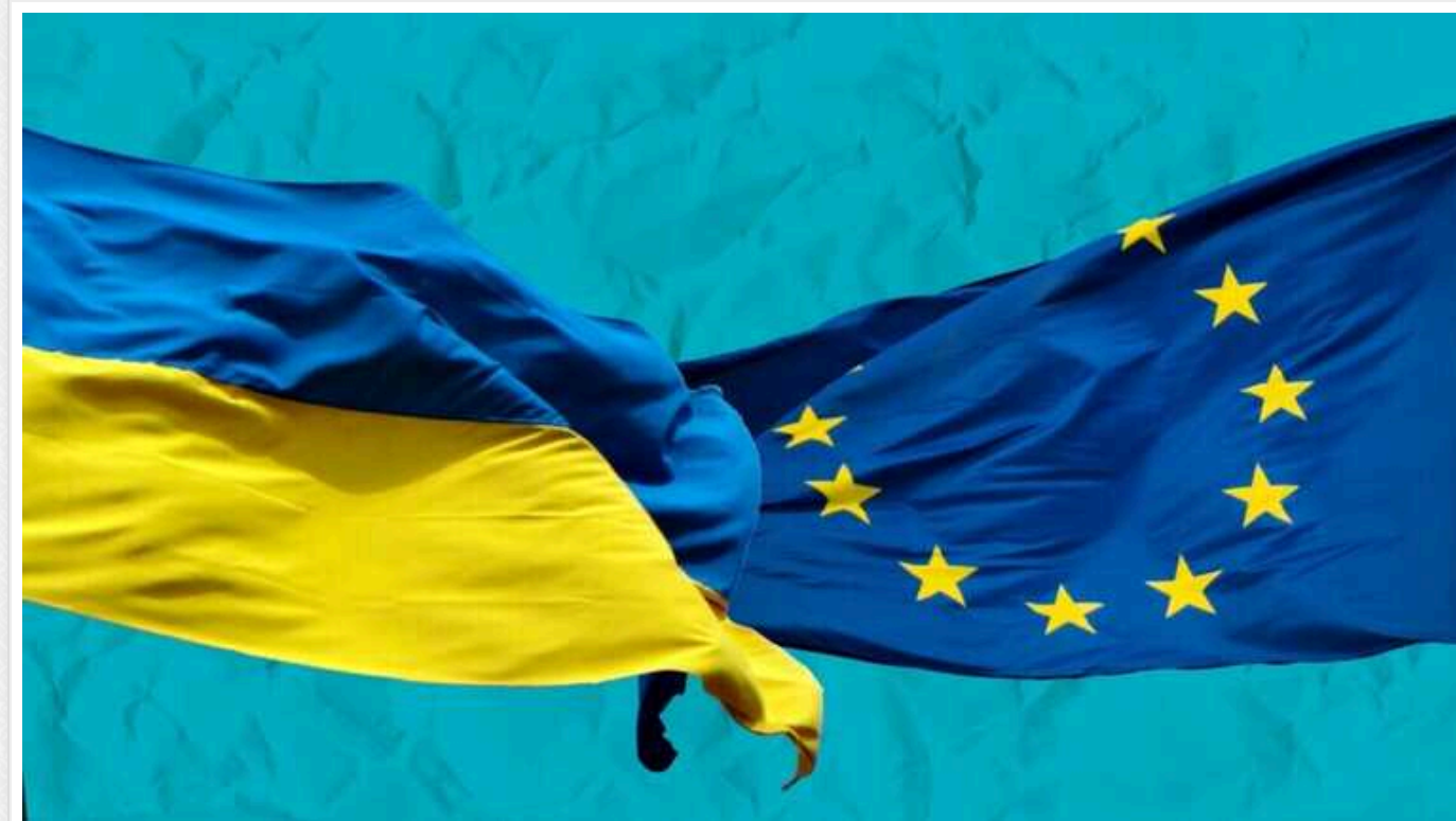
У ЄС запровадили фінансові обмеження, які потенційно зачеплять і українських біженців

Рада та парламент ЄС уклали угоду щодо боротьби з відмиванням грошей та фінансуванням тероризму.