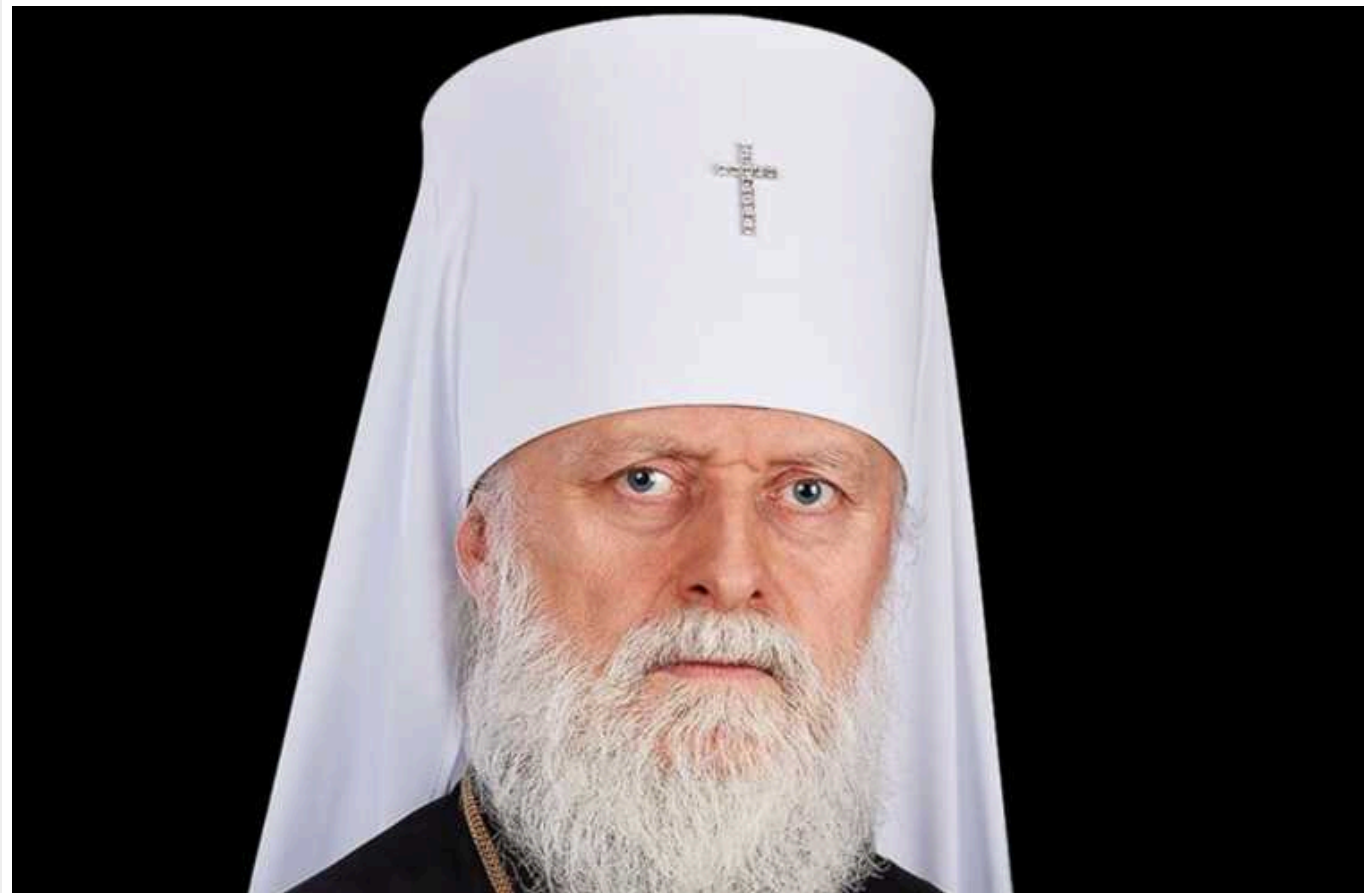
Естонія не продовжила посвідку на проживання главі Естонської ПЦ МП