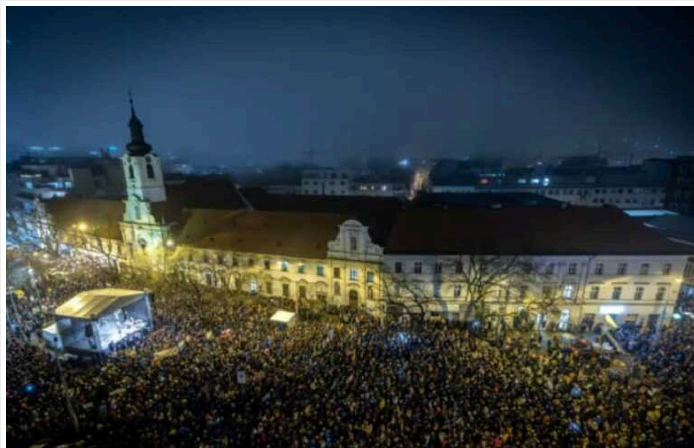
У Словаччині знову пройшли протести проти уряду Фіцо

У 23 містах Словаччини у четвер пройшли великі акції протесту проти уряду Роберта Фіцо, вимоги протестувальників розширилися.