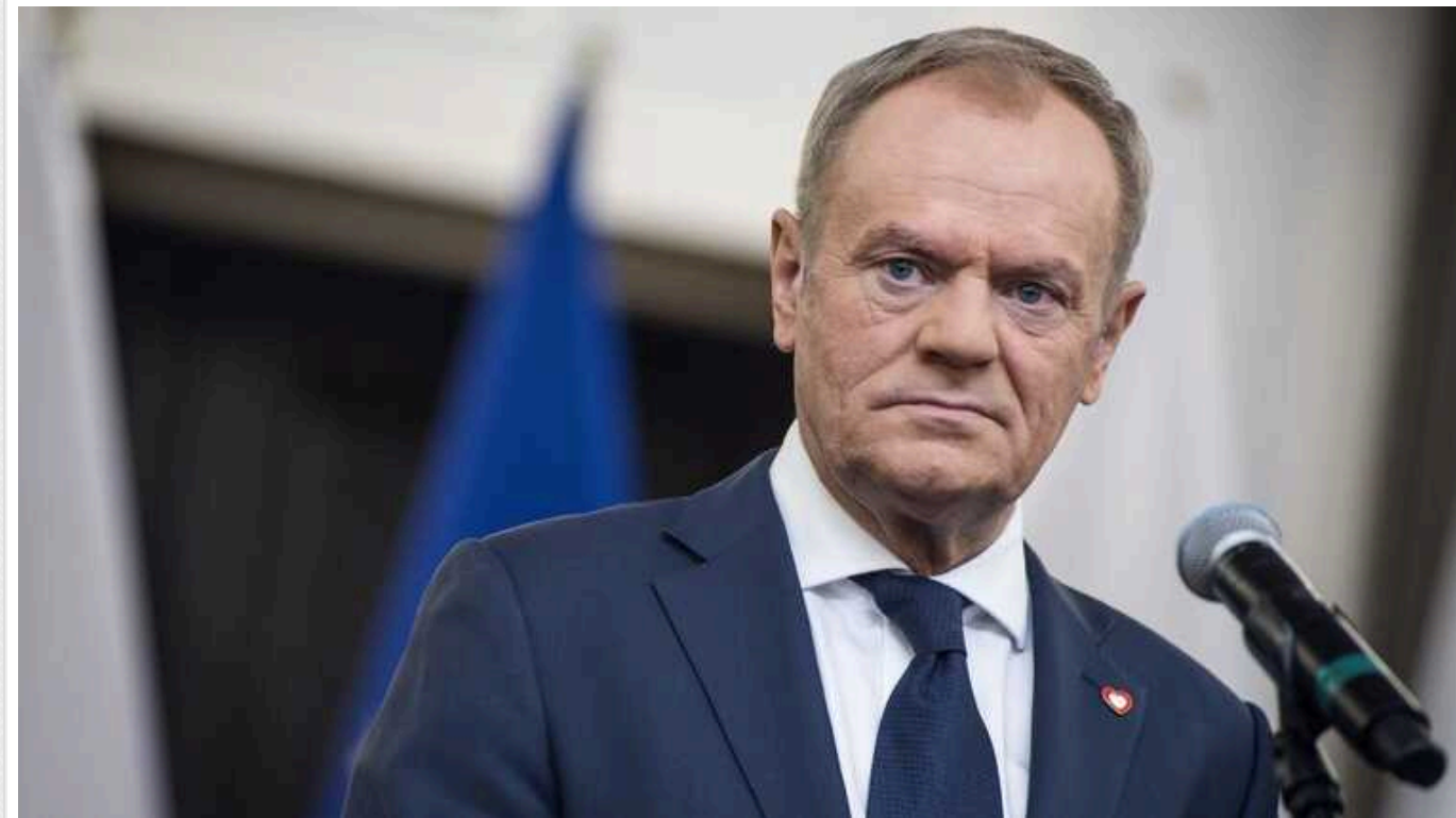
FT: Євросоюз розблокує виділення 100 мільярдів євро для Польщі після зміни уряду

Брюссель вивчає способи надати понад 100 мільярдів євро фінансування ЄС для Польщі, навіть якщо президент країни накладе вето на судову реформу Дональда Туска.