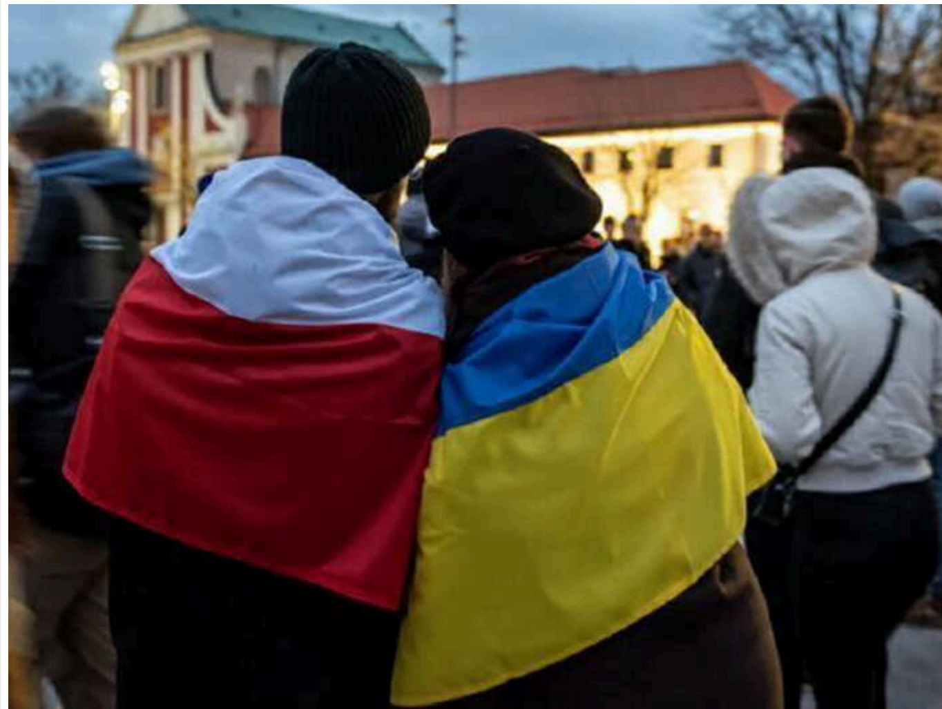
Влада Польщі спростувала продовження тимчасового захисту українським біженцям

Вчора багатьма телеграм-каналами пройшла новина про те, що Польща продовжила українцям тимчасовий захист до весни 2025 року.