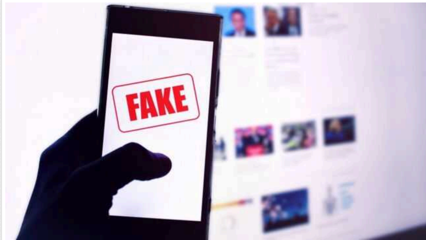
Сполучені Штати попереджають про наміри Росії налаштувати Європу проти України на виборах-2024

Росія готує "інформаційні операції" з метою налаштування громадської думки проти України напередодні виборів у країнах Європи в 2024 році.