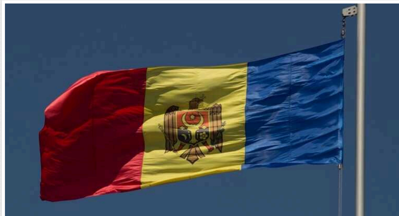
Молдова вимагає пояснень у Кремля через несанкціоновані навчання "миротворців" РФ у Придністров'ї

Делегація Молдови на засіданні Об'єднаної контрольної комісії 18 січня зажадала розгляду у зв'язку з проведенням російськими військовими навчань 22 грудня поблизу адміністративного кордону між правим і лівим берегами Дністра.