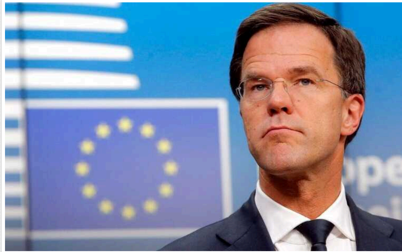
Bloomberg: Прихильники Рютте хочуть бачити його на посаді наступного Генсека НАТО

Прихильники чинного прем'єр-міністра Нідерландів Марка Рютте наполягають на тому, щоб він став наступним Генсеком НАТО. Це може статися вже цього року.