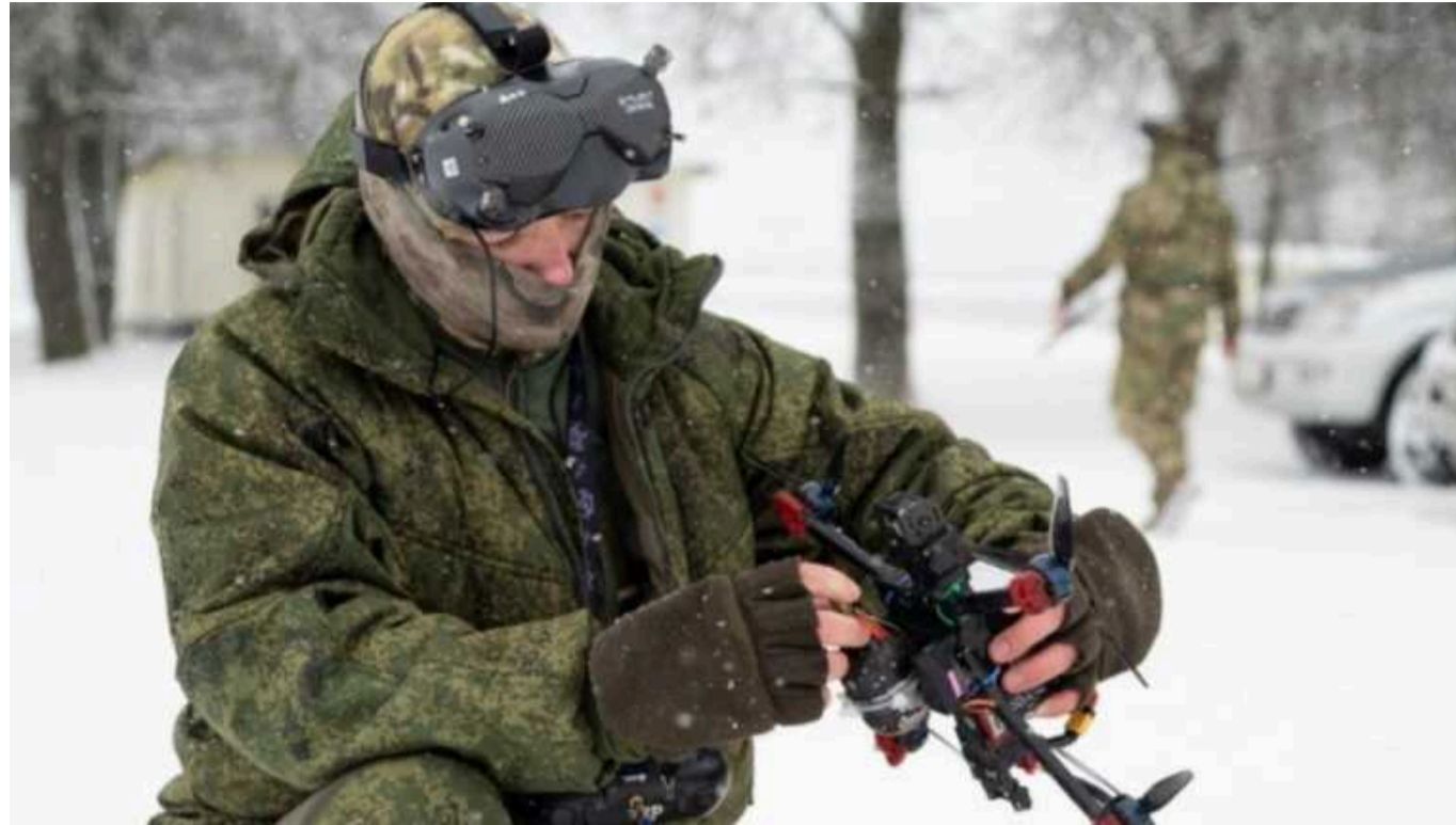
Як безпілотники з машинним зором змінять хід війни з РФ

Дрони із системою самозахоплення цілі — доволі витратна технологія, але окупанти готові в неї інвестувати, оскільки БПЛА з машинним зором у рази точніше уражають свої цілі.