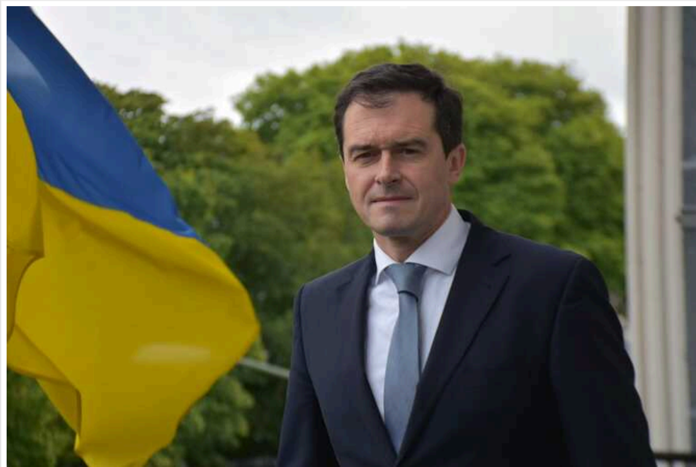
У разі накладання Угорщиною вето на пакет допомоги на 50 мільярдів євро Україні, є кілька варіантів виділити таке фінансування, – посол ЄС

У разі накладання прем'єр-міністром Угорщини Віктором Орбаном вето на лютневому саміті Європейського союзу на схвалення пакета допомоги Україні на 50 мільярдів євро, є кілька способів для Брюсселя виділити таке фінансування, попри позицію Будапешта.