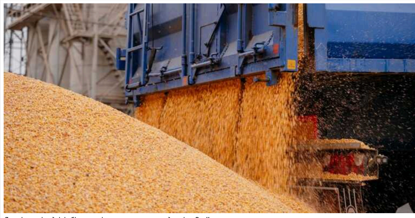
Латвія торік вдвічі збільшила імпорт зернових продуктів з Росії

За 11 місяців минулого року Латвія імпортувала з Росії 333 225 тонн зернових продуктів, що на 51,5% більше, ніж за відповідний період 2022 року.