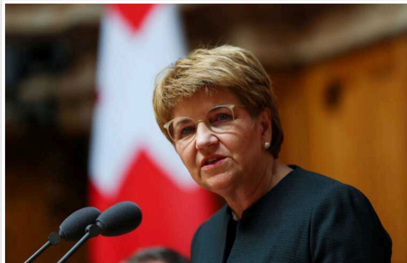
Президентка Швейцарії Амгерд відповіла на критику Кремля щодо підготовки до "саміту миру"

Президентка Швейцарії Віола Амгерд відреагувала на критику Російської Федерації з приводу підготовки до майбутнього мирного саміту щодо України.