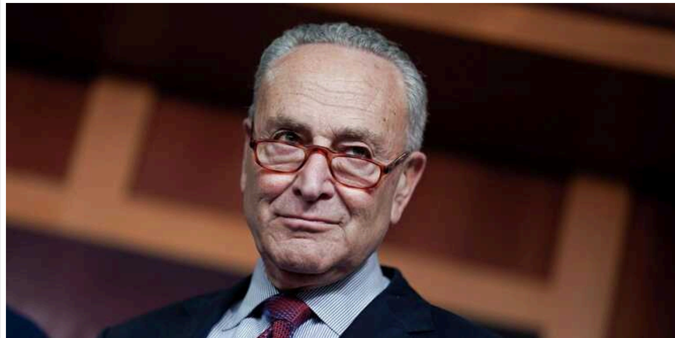
Запит президента США стане наступною ціллю після тимчасового бюджету, – лідер демократів у Сенаті

Прийняття пакету національної безпеки, який передбачає нове фінансування для України, стане наступною ціллю Сенату після тимчасового бюджету.