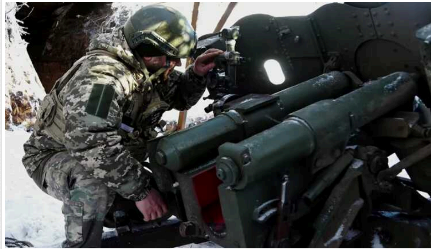
На Авдіївському напрямку ЗСУ стрімко знищують бронетехніку загарбників, – ISW

На Авдіївському напрямку українські захисники активно нищать ворожу бронетехніку, якою росіяни підтримують піхоту. Зокрема, на цьому напрямку за три дні окупанти втратили 41 одиницю бронетехніки.