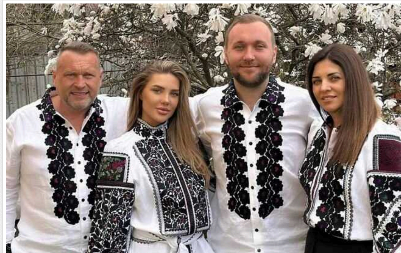
Суд взяв під варту із заставою третього фігуранта у справі Гринкевичів

Печерський районний суд Києва обрав запобіжний захід у вигляді тримання під вартою третьому підозрюваному справи про постачання неякісного одягу для ЗСУ.