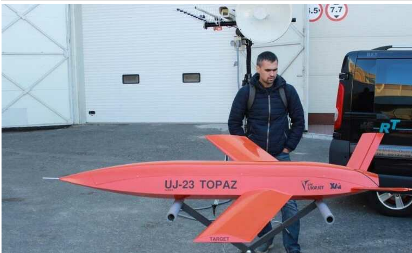
Компанія UKRJET продемонструвала реактивний безпілотною UJ-23 Тораз із дальністю польоту 400 км

UJ-23 Тораз – это многоцелевая беспилотная авиационная система с реактивным двигателем, которая может использоваться в любое время суток и времени года, в том числе при неблагоприятных погодных условиях и противодействию РЭБ противника. UJ-23 может выполнять задачи для разведывательных и военных операций.