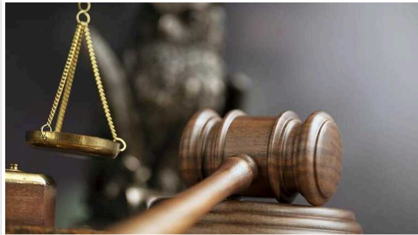
На Вінниччині реєстратора виправдали від звинувачень у корупції

Липовецький районний суд Вінницької області визнав невинуватим колишнього державного реєстратора речових прав на нерухоме майно відділу надання адміністративних послуг Турбівської селищної ради.