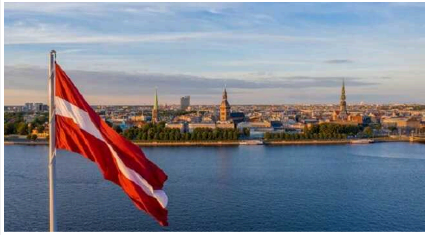
Латвія розірвала договір про правову допомогу з РФ

Парламент Латвії сьогодні, 18 січня, вирішив розірвати з Росією договір про правову допомогу та правові відносини у цивільних, сімейних і кримінальних справах.