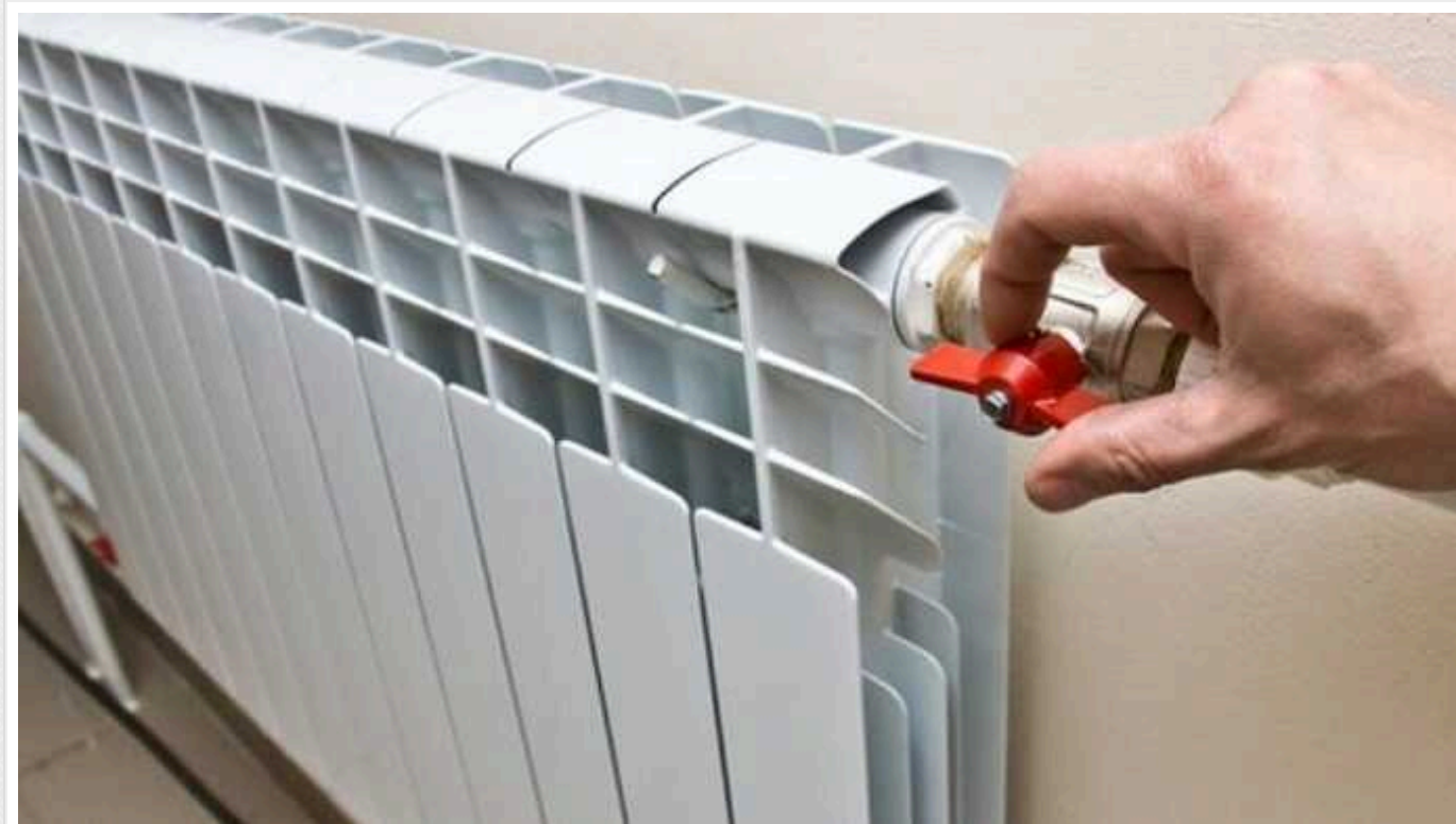
Опалення державних резиденцій у Києві оцінили у 36,1 мільйонів гривень: оголосили закупівлю

Управління адміністративними будинками Державного управління справами оголосило закупівлю. На опалення державних резиденцій виділять понад 36 мільйонів гривень.