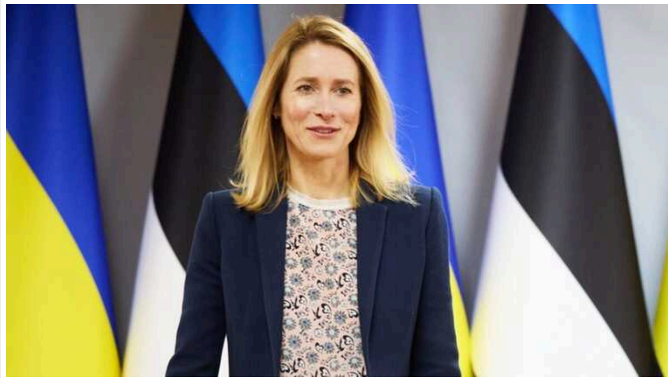
Politico: Прем'єрка Естонії Каллас може замінити Борреля й очолити дипломатію ЄС

Прем'єрка Естонії Кая Каллас після виборів до Європейського парламенту може стати верховним представником Європейського Союзу із закордонних справ та політики безпеки. Жінка, можливо обійме цю посаду замість Жозепа Борреля.