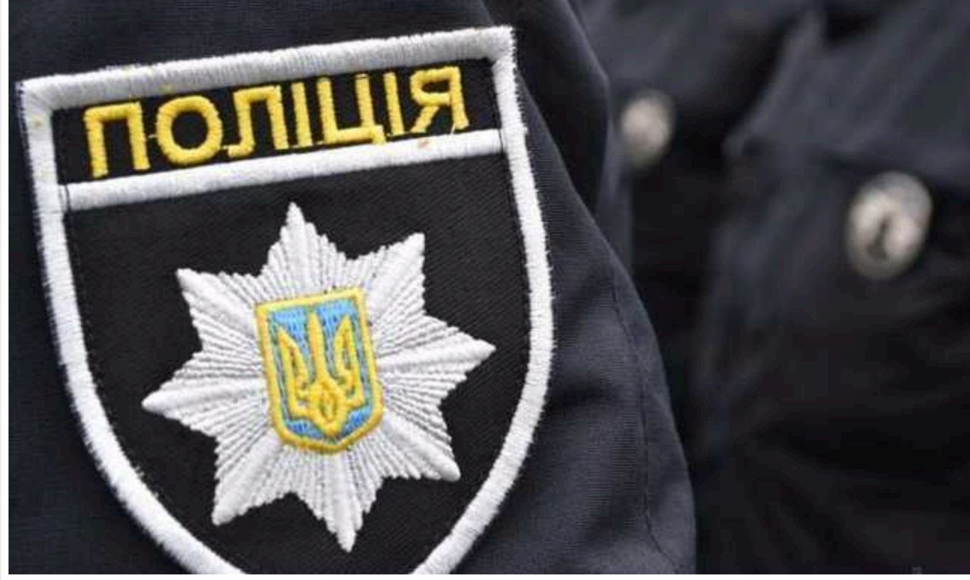
Справу наркосиндикату з Кривого Рогу передали в суд: діяли шість груп, вилучено "товару" на 170 мільйонів гривень

У Кривому Розі судитимуть 38 учасників місцевого наркосиндикату "Двадцятіський". Мережа організованих нарколабораторій дозволяла зловмисникам виготовляти до 40 кг психотропів щомісяця.