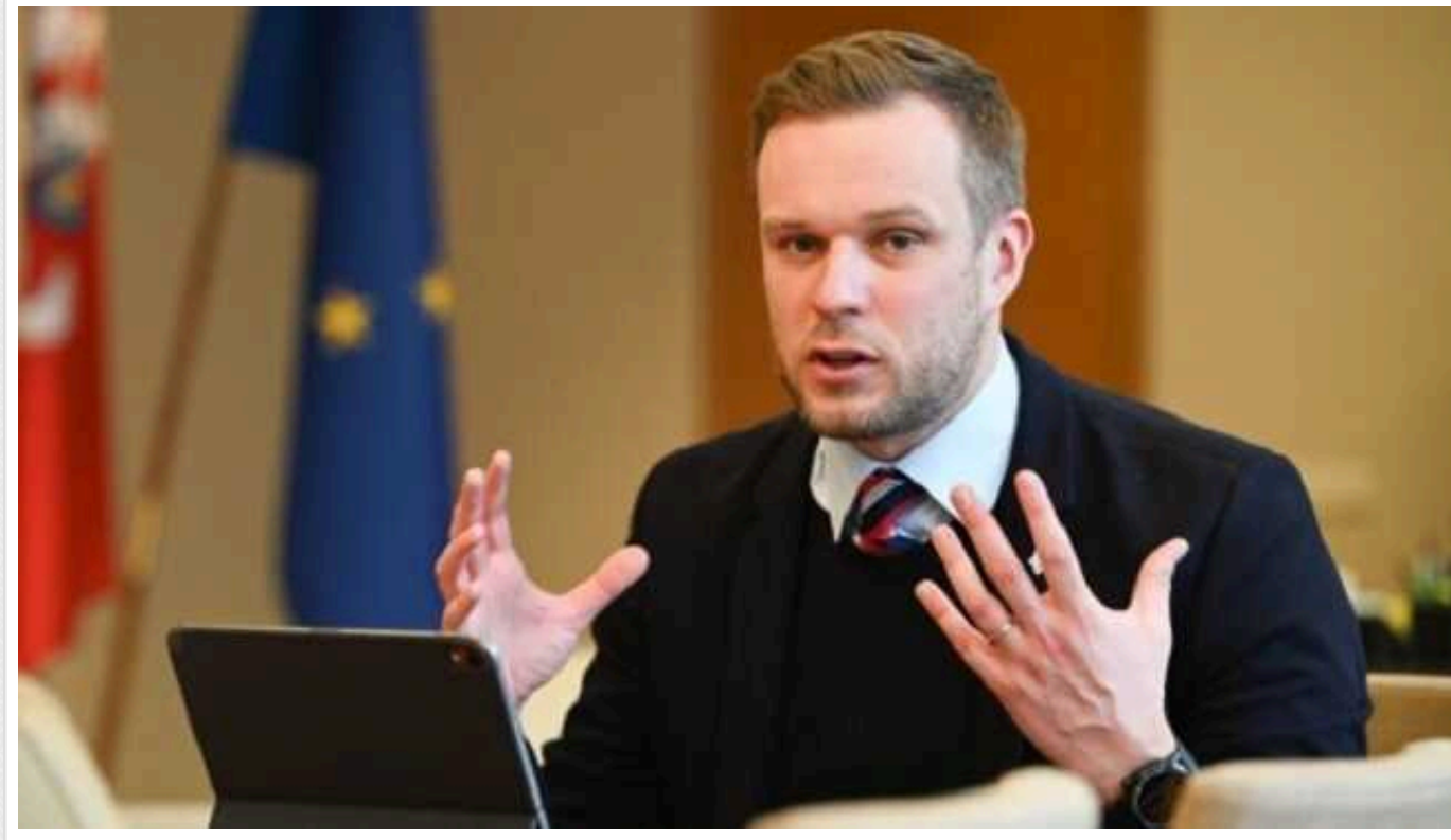
Для перемоги у війні Україні потрібно 400 HIMARS, - глава МЗС Литви

Міністр закордонних справ Литви Габріелюс Ландсбергіс заявив, що Україні для перемоги над країною-окупантом РФ потрібно не 40 реактивних систем залпового вогню HIMARS, а 400. Він закликав партнерів передати Києву все, що потрібно для перемоги над агресором.