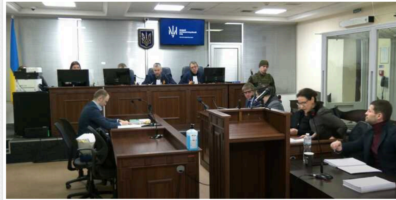
ВАКС: Фіксація відкритого судового процесу – беззастережне право громадян

Відеофіксація у залі судових засідань: хто може її проводити, чи потрібні для цього окремі дозволи.