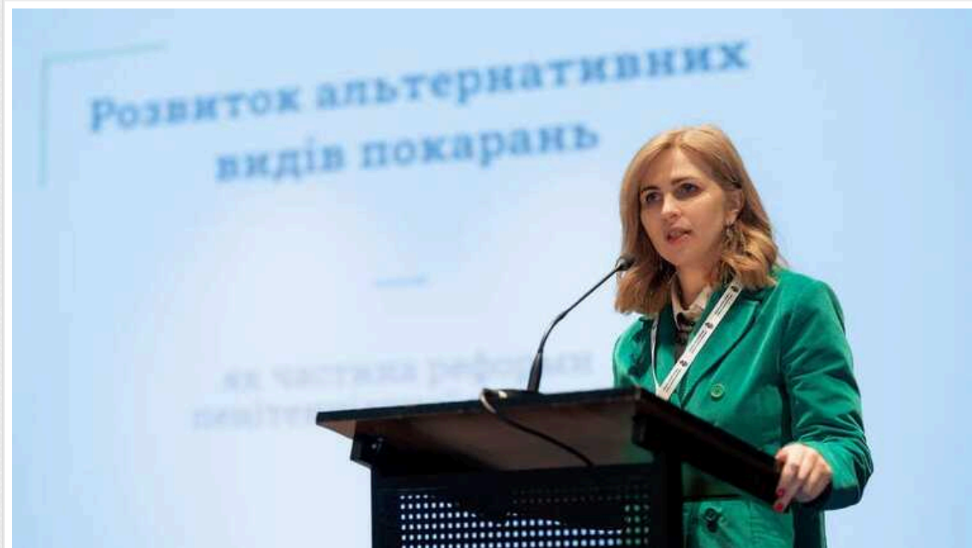
Мін'юст хоче дозволити засудженим воювати: уже напрацювали зміни до законів

Міністерство юстиції України напрацювало зміни, завдяки яким люди із судимістю зможуть долучитися до оборони країни, адже зараз законодавчо заборонено мобілізацію засуджених.