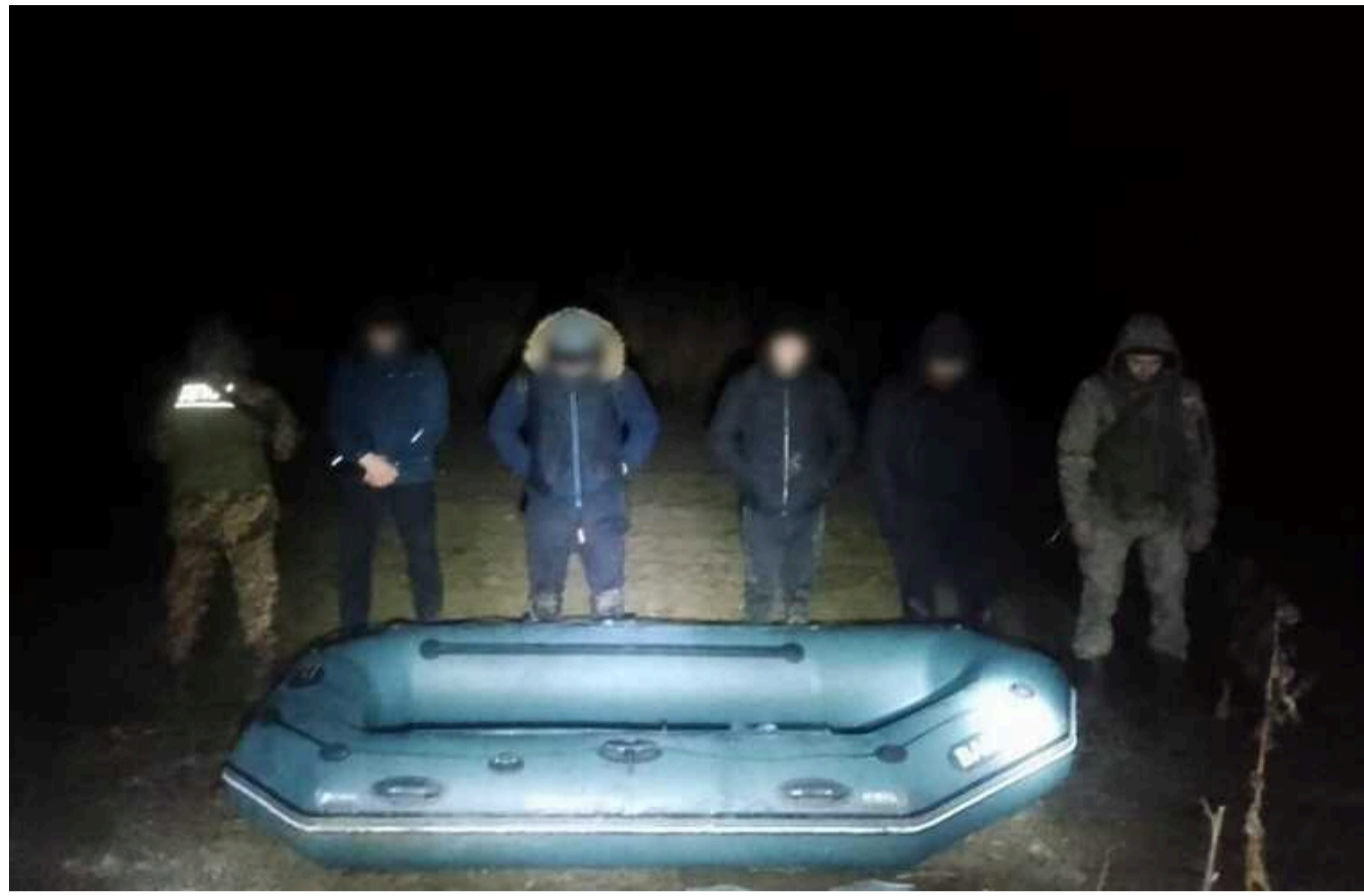
На Закарпатті прикордонники затримали ще чотирьох порушників: планували потрапити до Угорщини на гумовому човні

Українські прикордонники близько 3.00 18 січня затримали чотирьох чоловіків із гумовим човном у Закарпатській області біля кордону з Угорщиною. Про це повідомляється на сайті Держприкордонслужби України.