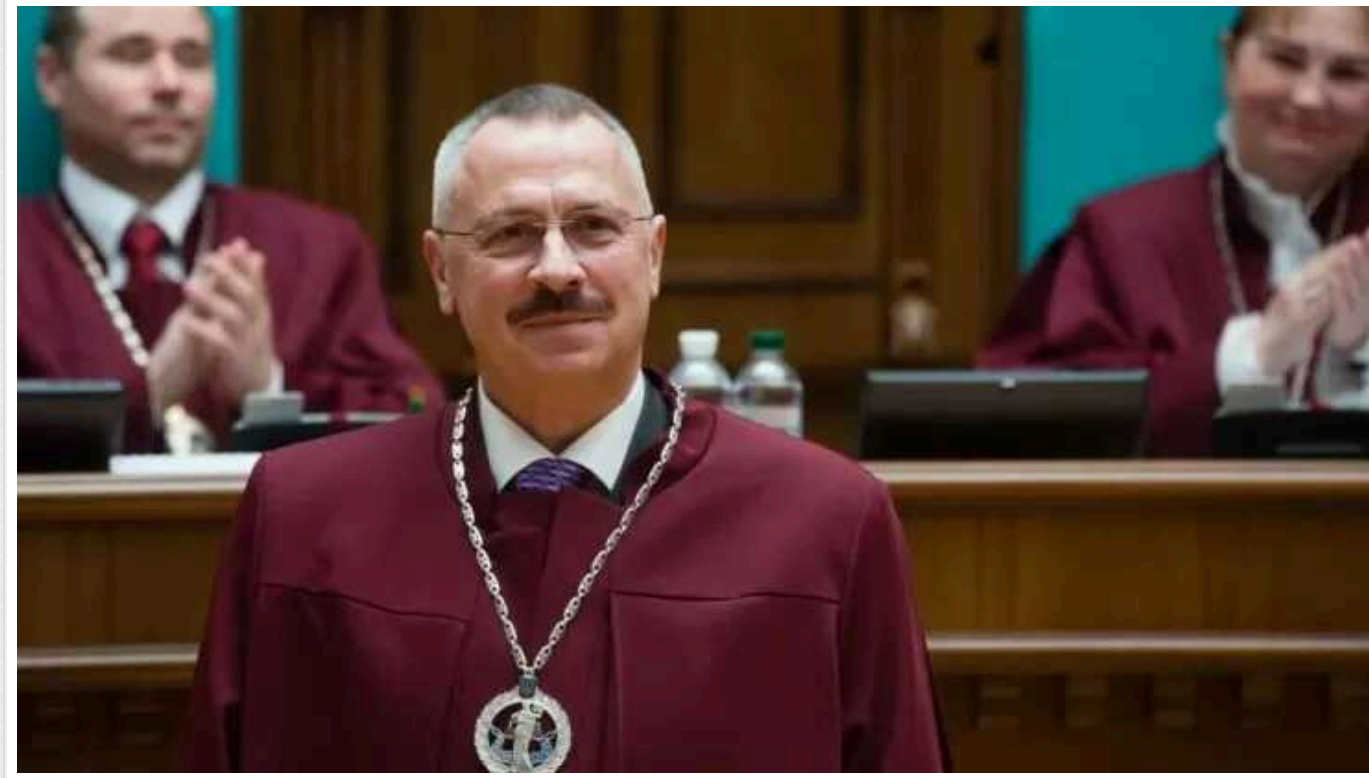
НАЗК: Виконувач обов'язків голови Конституційного суду може позбутися посади

На виконувача обов'язків Конституційного суду України Сергія Головатого склали протокол про адміністративне правопорушення. Тепер він може втратити цю посаду.