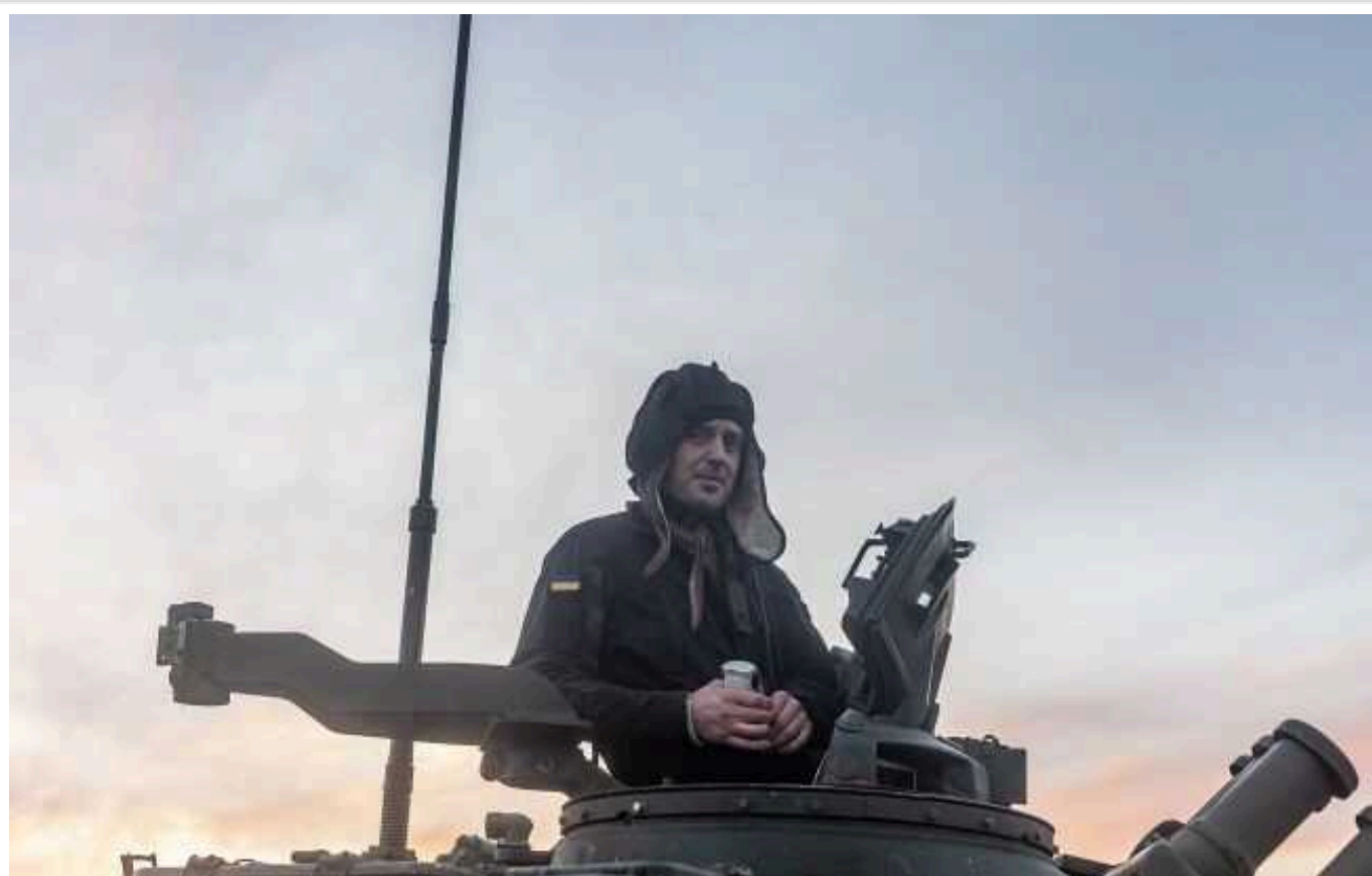
Ситуація на фронті: протягом доби відбулося 114 бойових зіткнень, ворог завдав 1 ракетного та 48 авіаційних ударів, здійснив 38 обстрілів

Українські воїни продовжують утримувати позиції на лівобережжі Дніпра, відбили атаки росіян поблизу Богданівки (Донецька область) і уразили пункт управління окупантів.