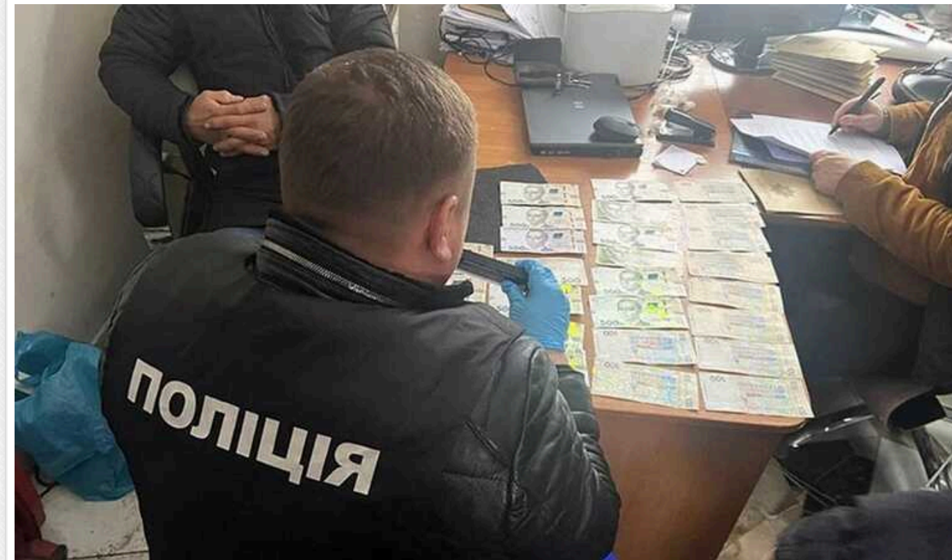
У Хмельницькому комунальник вимагав хабарі за захоронення автомобільних шин

У Хмельницькому на хабарі затримали посадовця одного з комунальних підприємств. Слідчі встановили, що комунальник брав хабарі від підприємців за незаконне захоронення використаних автомобільних шин, які потребують спеціальної утилізації.