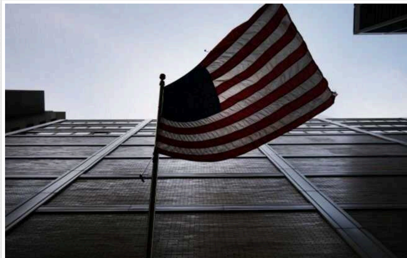
Nikkei: США тиснуть на банки в Гонконгу для дотримання санкцій проти Росії

Представники Міністерства фінансів США чинили тиск на китайські та іноземні банки в Гонконгу, щоб вони виконали нові санкції адміністрації Джо Байдена щодо російської військової промисловості.