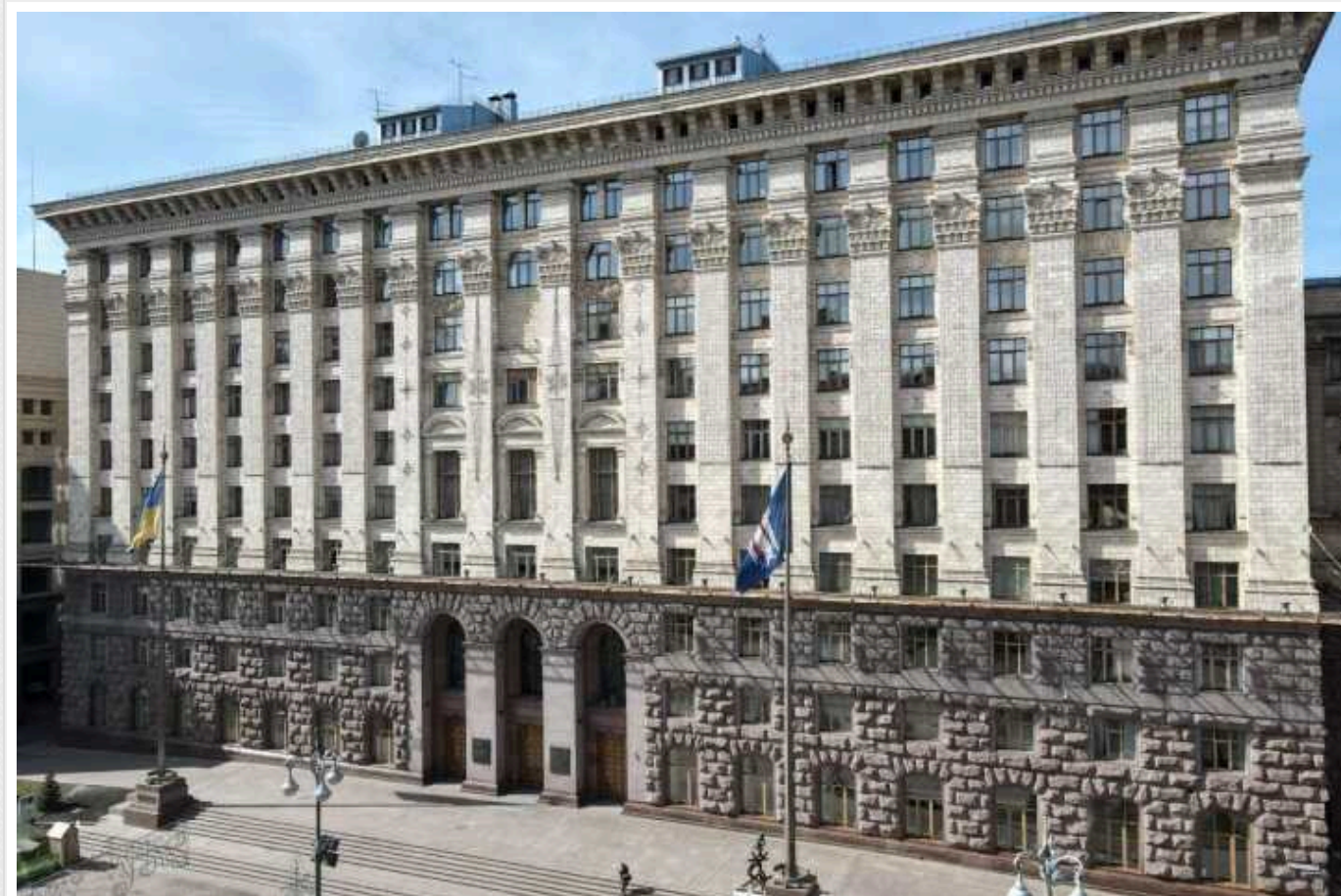
У столиці перейменували одразу 29 об'єктів: з'явився сквер імені Дмитра "Да Вінчі" Коцюбайла

У Києві перейменували ще 29 об'єктів. Відповідні рішення було ухвалено депутатами в четвер, 18 січня, під час засідання Київської міської ради.